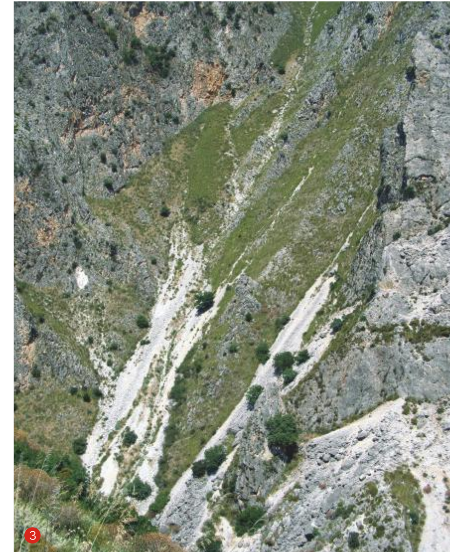
LE FOTO / THE PHOTOS 1 La Gola di Isnello The Gorge of Isnello 2 Torrente Isnello The Isnello torrent 3 Conoidi detritici Detrital cones 4 Piano di faglia Fault plane 1